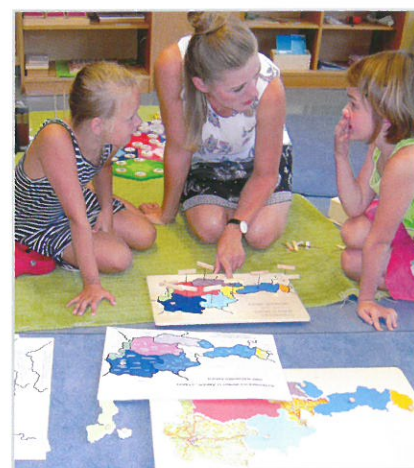
Die Lehrerin führt in den neuen Lernstoff ein.

einen respektvollen, wertschätzenden Umgang, dabei sollen die Kinder verantwortungsbewusst miteinander umgehen. Im Klassenrat werden Themen besprochen, die für die Kinder und Lehrer wichtig sind.