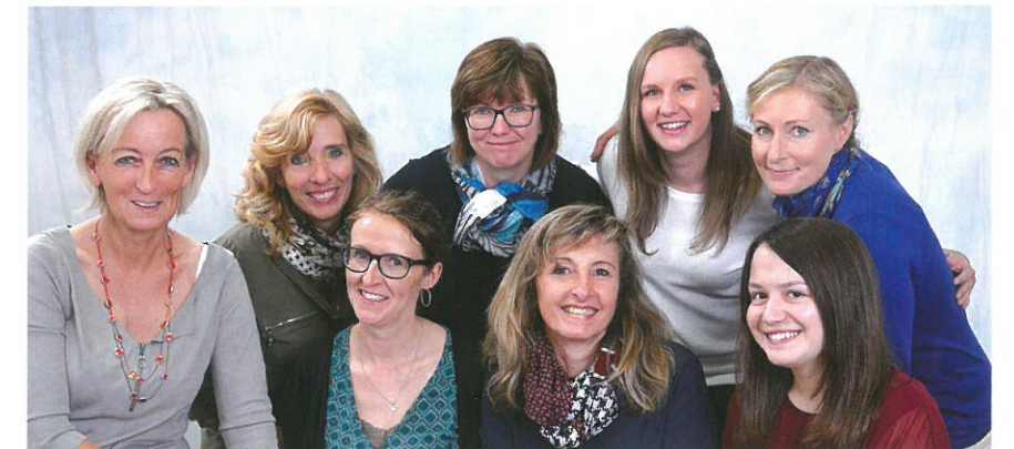
Effekt Foto Salzburg