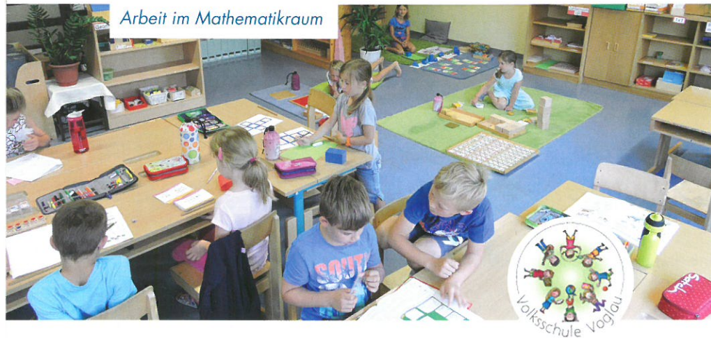
Arbeit im Mathematikraum

Seit jeher arbeiten der Kindergarten und die Volksschule Voglau in enger Zusammenarbeit Tür an Tür. Ab diesem Schuljahr wurde das Betreuungsangebot im Kindergarten ausgebaut. So werden auch Schulkinder am Nachmittag in der alterserweiterten Gruppe betreut. Die pädagogischen Lernkonzepte wurden verstärkt zwischen der Volksschule und dem Kindergarten abgestimmt.